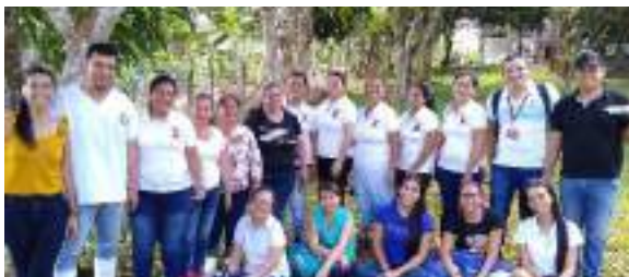
Talleres participativos en Puerto Rico, Meta

El fortalecimiento de capacidades se realizó a través de talleres, cursos, giras de intercambio y metodologías que a través del desarrollo de capacidades de los diferentes actores organizaciones, funcionarios, actores claves, etc. les permitió tener una participación efectiva para incidir en los instrumentos de planificación municipal, estructuración de modelos de negocios verdes y acceso a financiamiento verde.