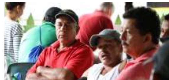
Talleres participativos en Puerto Rico, Meta

Adicionalmente en los 6 municipios en que se trabajaron, se integró la orden 3 de la sentencia de la Amazonía en sus EOT.