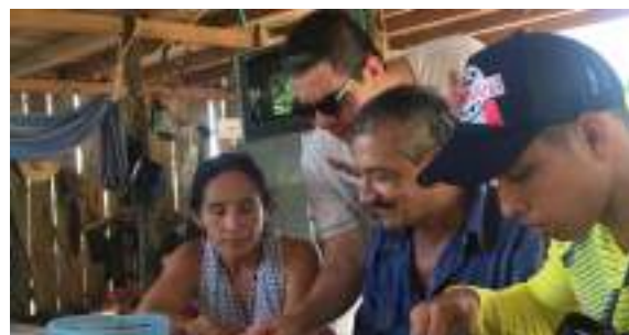
Asistencia Técnica de cacao

Se sensibilizaron a las familias productoras sobre la importancia de conservar áreas estratégicas ambientales en sus predios y veredas y a través de la firma de un acuerdo, se comprometieron a conservar las áreas de bosque que han delimitado en sintonía con el ordenamiento territorial con enfoque ambiental.