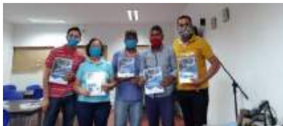
Red de reporteros comunitarios

Una vez estos líderes y representantes de los grupos motor del PDET fueron capacitados, hoy en día se encargan de visibilizar las historias de transformación de sus territorios en la página de Facebook de la Red de Reporteros, que cuenta con más de 10.000 seguidores, y las páginas de la Agencia de Renovación del Territorio.