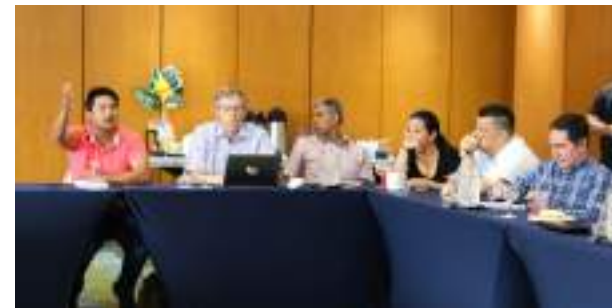
Comité de Conducción en el Meta

En las regiones de Meta y Caquetá, el proyecto se implementó con apoyo de entidades gubernamentales del orden departamental y municipal, autoridades ambientales regionales, otras instituciones socias y actores clave, quienes participan activamente en el desarrollo del proyecto a través de un comité de conducción.