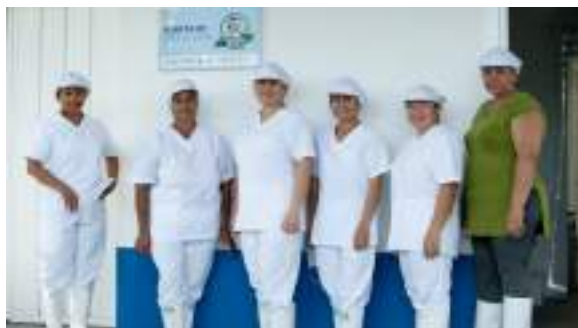
Asociación Asmujima, Caquetá

Para definir la demanda efectiva y el potencial de negocio de crédito agropecuario verde, el proyecto inició con una fase intensiva de investigación cuantitativa y cualitativa de los mercados agropecuarios de Meta y Caquetá. Los resultados revelaron, que entre el 5% – 10% de los pequeños productores tienen una demanda para crédito verde.