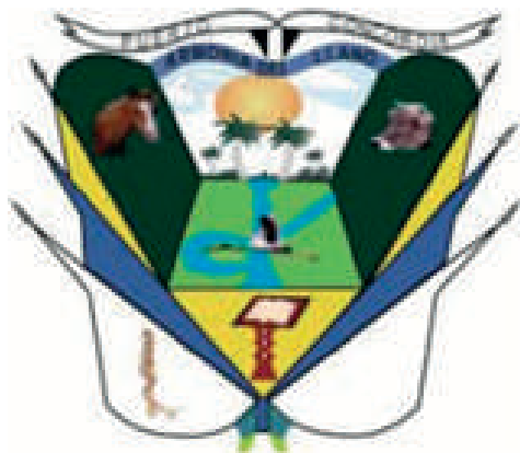
PUERTO CONCORDIA, META